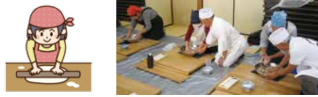
おいしくできました!